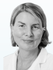
Dr. Thora Hartmann-Schneiders Orthomol